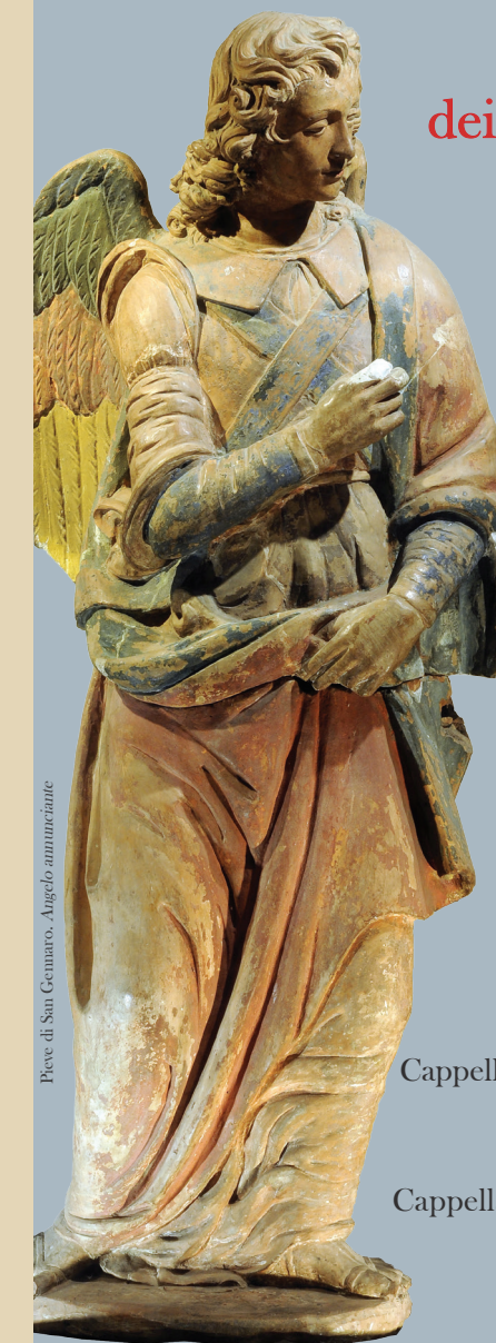
Pieve di San Gennaro - Angelo ammirante

Lucca Palazzo Bernardini Cappella Villa Oliva